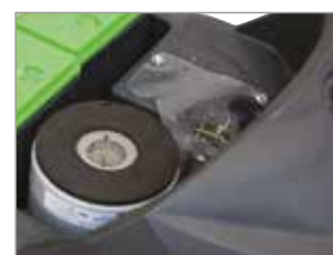
КОМПЛЕКТ РОБОЧИЙ ГРАМИ